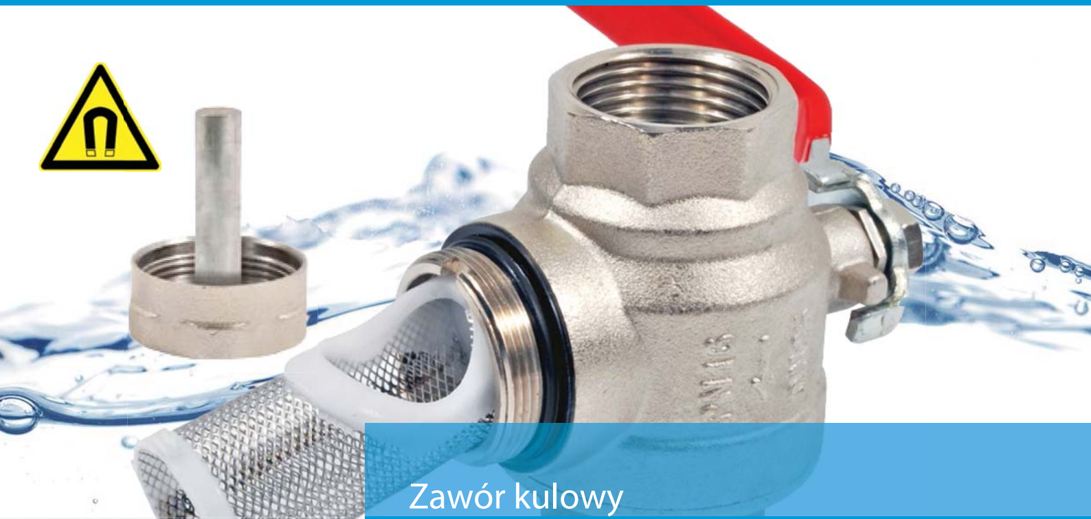
Zawór kulowy z filtrem i magnesem