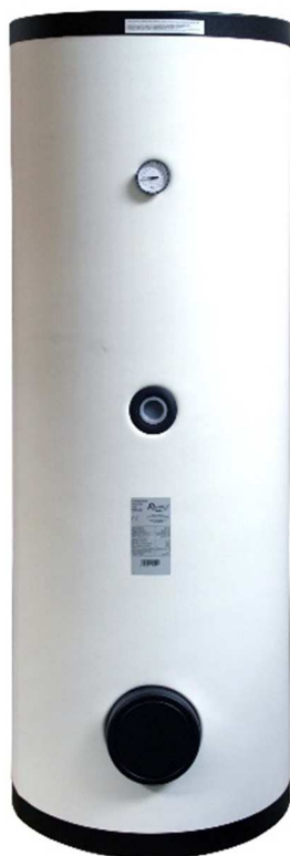
Elektrické topné těleso