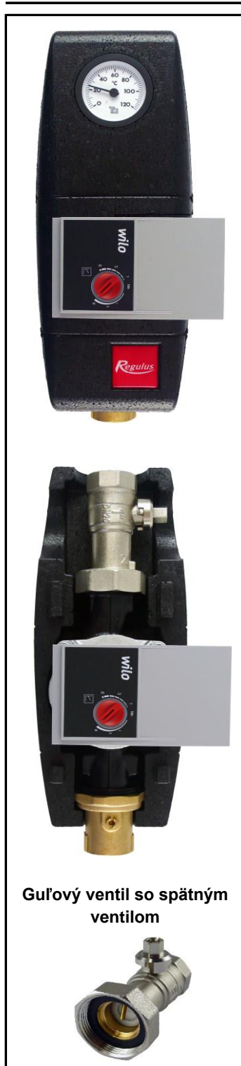
Guľový ventil so spätným ventilom