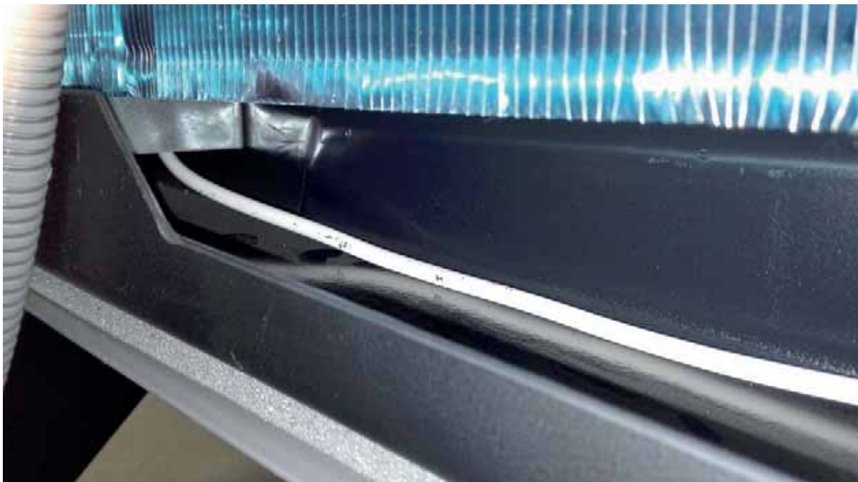
Obr. 2 - Pretiahnutie ohrevného kábla zberačom kondenzátu