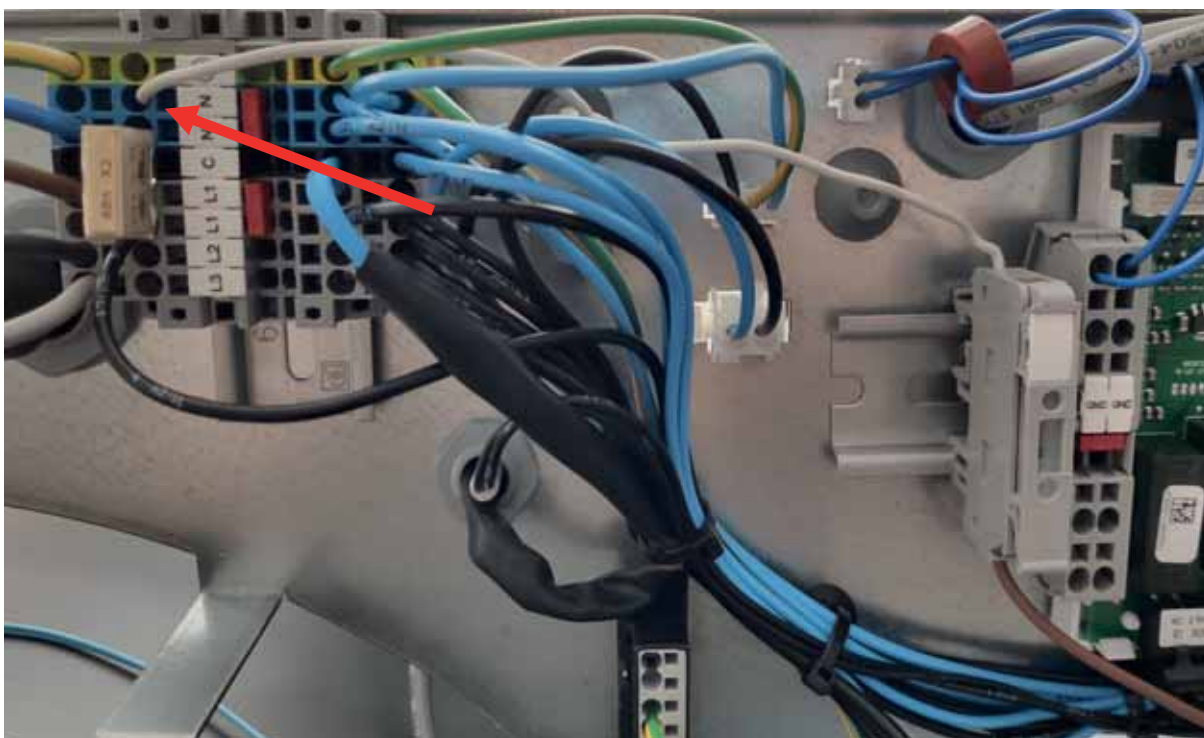
Obr. 1b - Pripojenie ohrevného kábla na svorkovnici - tepelné čerpadlo CTC rady 600